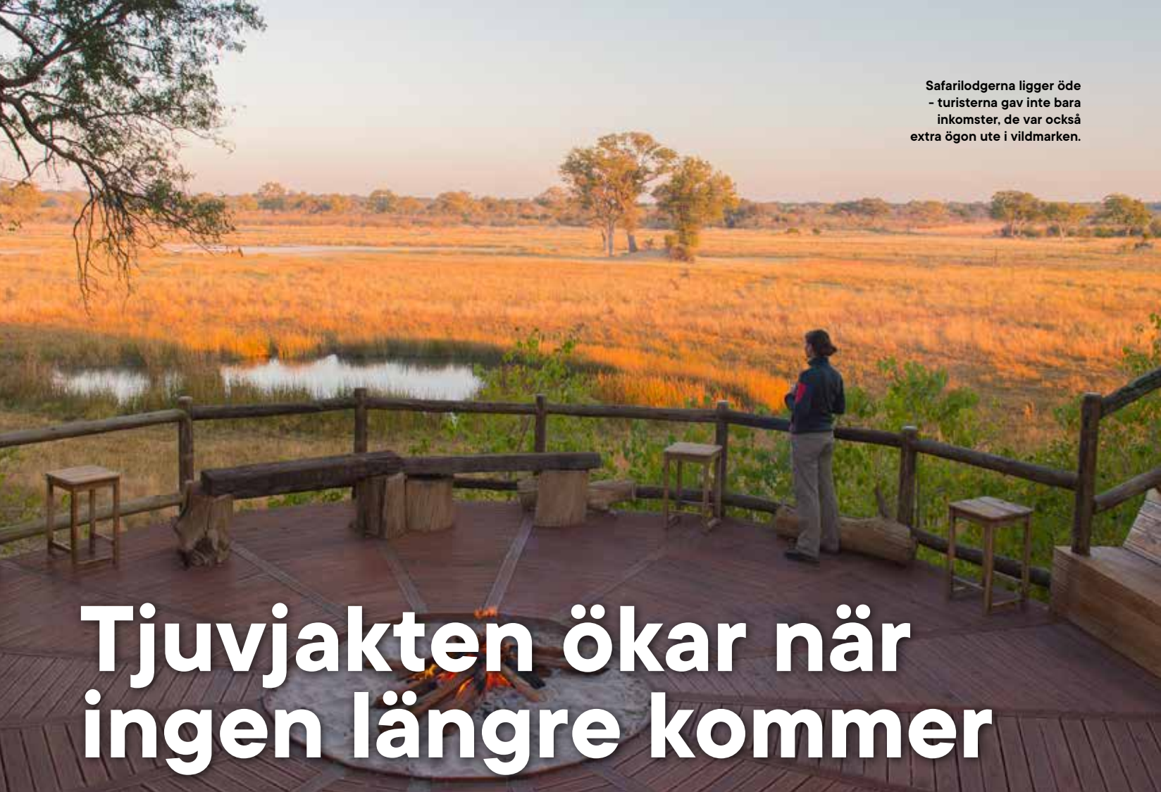
Safarilodgerna ligger öde - turisterna gav inte bara inkomster, de var också extra ögon ute i vildmarken.